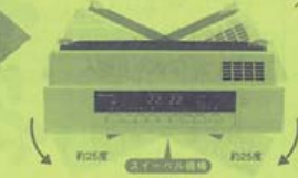
約25度 左右の方向へ調整可能

プラズマクラスター機能付 これが健康テクノロジー 「プラズマクラスター」 技術。 お部屋の空気を快適に!